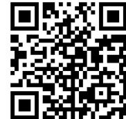
Fuel list on Trangia website

ACHTUNG: Nachfüllen von Brennstoff in einen heißen Brenner ist lebensgefährlich! Mit der Hand kontrollieren, dass der Brenner erloschen und abgekühlt ist. ADVARSEL: Det er livsfarlig å fylle med sprit i en varm brenner. Kjenn etter med hånden at den er sloknet og avkjølt. VAROITUS: Hengenvaarallista kaataa polttoainetta kuumaan polttimeen. Varmista kädellä kokeilemalla, että poltin on sammunut ja jäähtynyt. ATTENZIONE: Pericolosissimo riempire un bruciatore ancora caldo. Controllare con la mano che la fiamma sia spenta e che il bruciatore si sia raffreddato. ATTENTION: Il y a danger à remplir l'appareil lorsque le brûleur est chaud. Contrôler au toucher qu'il est bien éteint et refroidi.